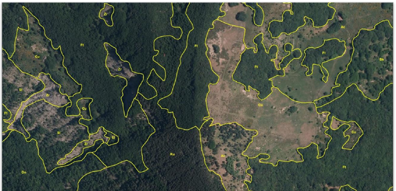
Figura 1 – Ortofoto AGEA 2011 con la copertura della vegetazione aggiornata.

Il grande dettaglio delle ortofoto ha permesso di ridisegnare con precisione i limiti dei poligoni riferiti alle varie tipologie di vegetazione e aggiornare le aree dove si erano registrati cambiamenti del tipo di vegetazione presente dovuti ad evoluzione della stessa nel tempo o ad interventi antropici.